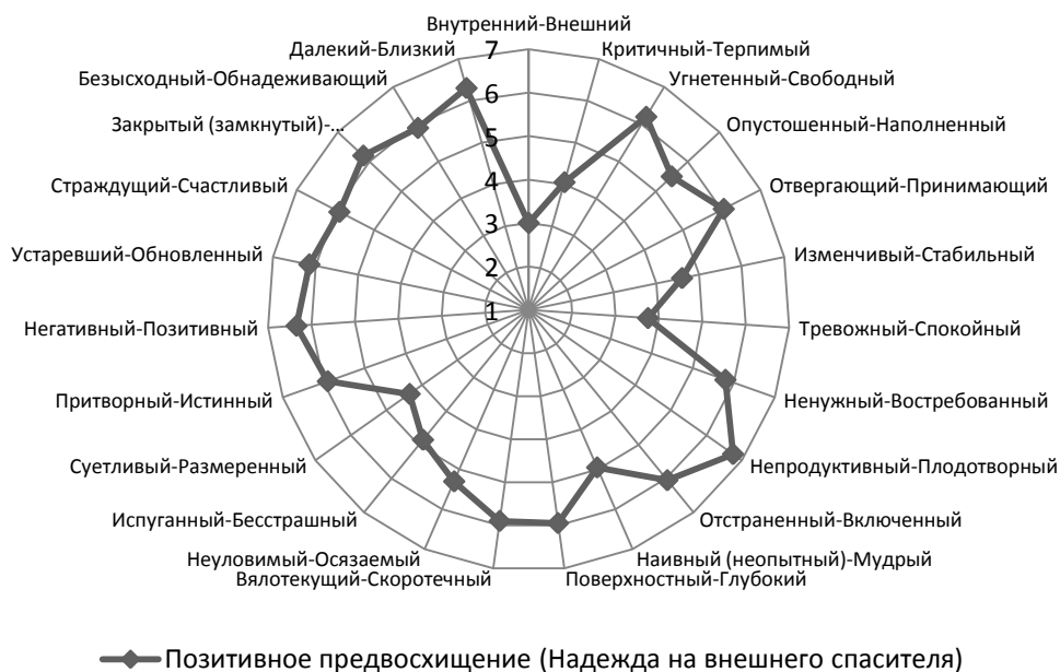
Рис. 5. Семантическое пространство фактора «Позитивное предвосхищение (Надежда на внешнего спасителя)»

Наряду с ощущением свободы, принятия, плодотворности, а также чувством открытости, свидетельствующим о гармоничном взаимодействии с внешним миром, возникает противоречивое чувство тревоги, сопровождающееся критичностью, изменчивостью, суетливостью и в какой-то степени наивностью. Гармоничное проживание женщиной на уровне ролей во внешней реальности позволяет ей опираться на данный внешний ресурс в трудные жизненные периоды. Становится понятным, почему в основе данного состояния лежит надежда и вера в «освободителя». То есть в данном случае женщина опирается на внешний ресурс, а не внутренний.