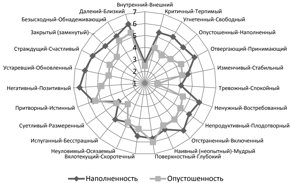
Рис. 2. Семантическое пространство фактора «Опустошенность - Наполненность»

Наполненность в середине жизни отличается терпимостью, свободой, принятием, спокойствием, востребованностью, продуктивностью, скоротечностью, бесстрашием, обновленностью, открытостью и др. В целом, это более позитивное состояние для женщины. Для опустошенности характерно преобладание состояния тревоги и испуга, при одновременном ощущении глубины переживания. Подобное состояние является следствием восприятия женщиной собственной трансформации как угрожающей ее целостности. Большая часть женских ресурсов в такой ситуации уходит на переживание тревоги, которая ощущается как напряжение, чувство неопределенности, потери ресурса.