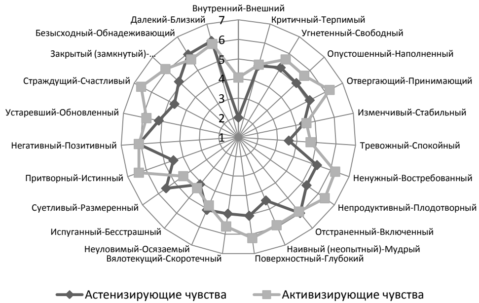
Рис. 3. Семантическое пространство фактора «Активизирующие – Астенизирующие чувства»

Переживания испытуемых, квалифицирующих свое состояние как «Астенизирующие чувства» менее выражены, испытуемые старались избегать при ответах крайних оценок. Подобная стертость, размытость переживаний может свидетельствовать об астенизации и погруженности в себя. Женщины, чьи переживания характеризуются «Активизирующими чувствами», более открыты для окружающих, они не боятся крайнего выражения чувств.