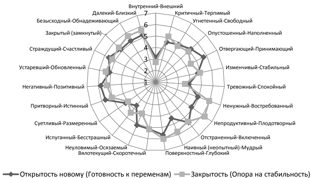
Рис. 4. Семантическое пространство фактора «Закрытость (Опора на стабильность) – Открытость новому опыту (Готовность к переменам)»

Анализ семантического пространства описываемого фактора позволил сделать вывод о том, что в основе состояния открытости новому опыту лежит ощущение ненужности, непродуктивности и неопытности, свидетельствующие о неудовлетворенности старыми моделями отношений (метафора «Метущаяся душа»), а также о желании найти новые опоры и ориентиры. С другой стороны, закрытость свойственна женщинам, чувствующим достаточную устойчивость, стабильность, осознающим свою продуктивность и востребованность. Все новое воспринимается как нарушение целостности и стабильности. Основная идея в том, чтобы сохранить мир вокруг неизменным, приспособиться к обстоятельствам, но ничего при этом не преобразовывать. Это обосновывает выбор женщинами метафор «Приспособленная машина», «Спринтер на длинной дистанции».