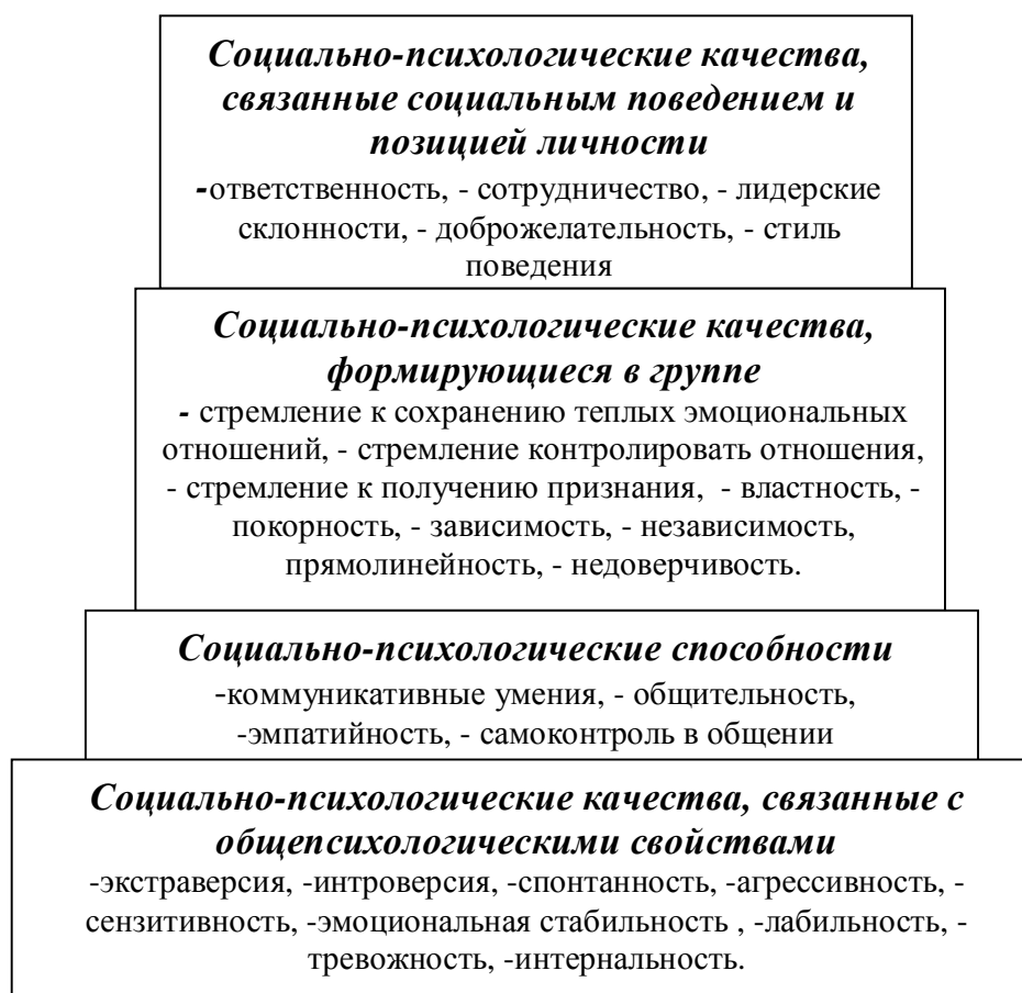
Рис. 1. Модель социально-психологической структуры аттракции

Проведенное на основе системного подхода изучение и обобщение различных социально-психологических качеств личности позволило предложить социально-психологическую структуру аттракции, состоящую из четырех уровней: социально-психологические качества, связанные с общепсихологическими свойствами; социально-психологические способности; социально-психологические качества, формирующиеся в группе; социально-психологические качества, связанные социальным поведением и позицией личности. Параметры компонентов структуры представлены в континууме гармонического и агармонического влияния на уровень аттракции человека (см. рис.1).